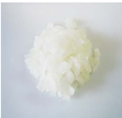
たまねぎみじん切り