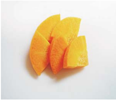
人参いちょう切り