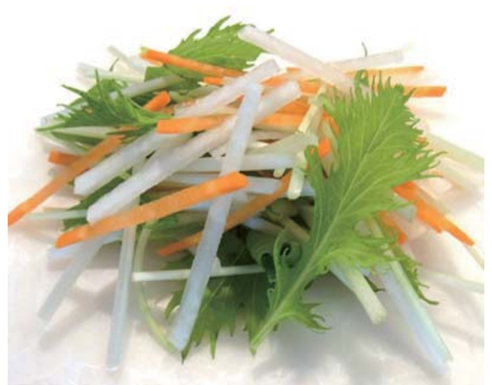
大根サラダセット