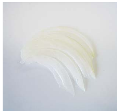
たまねぎスライス