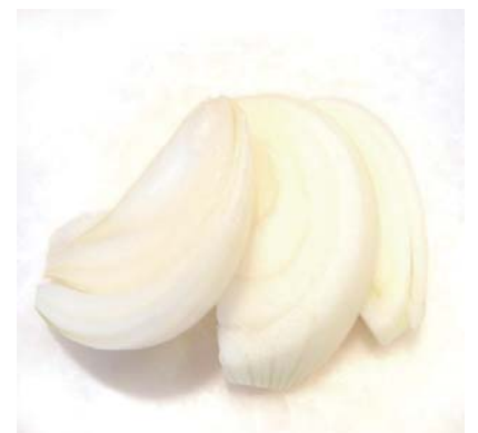
たまねぎくし切り