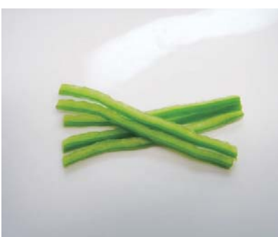
ピーマンスライス