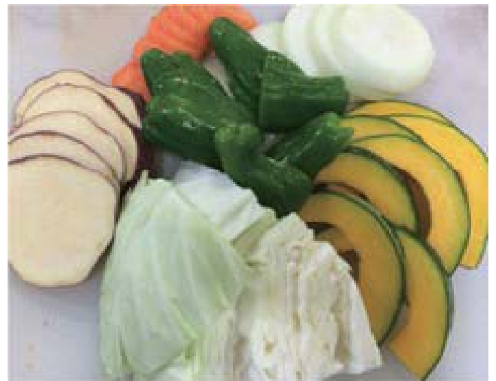
バーベキューセット