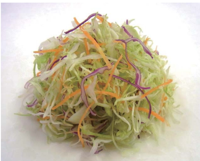
コールスローセット