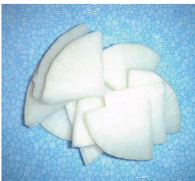
大根いちょう切り